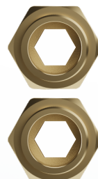
2 SZT. PÓŁŚRUBUNKÓW